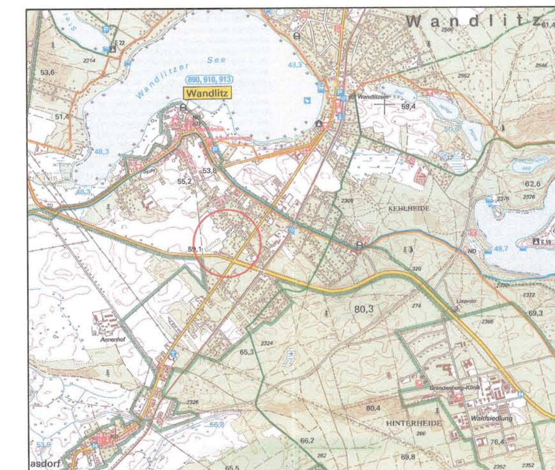
Übersichtskarte Wandlitz, unmaßstäblich